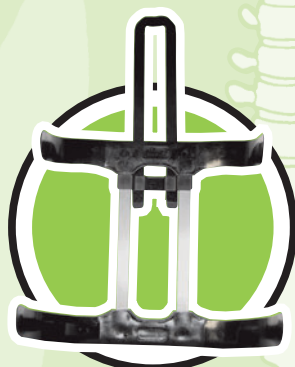
Stützelemente T-FLEX TL basic