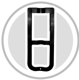
Abb.1 starres Kunststoffelement

Zur konservativen Stabilisierung und Entlordosierung (Aufrichtung der Wirbelsäule) sowie zur postoperativen Sicherung wird die TIGGES-Lumbalstützorthese basic zunächst mit dem innenliegenden stabilisierendem Kunststoffelement (Abb. 1) und dem zusätzlich aufrichtenden Delordosierungsgurt (Abb. 2) getragen.