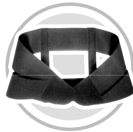
Abb. 2 Delordosierungsgurt