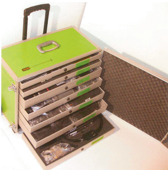
Der Orthesenkoffer von Tigges/T-Flex.