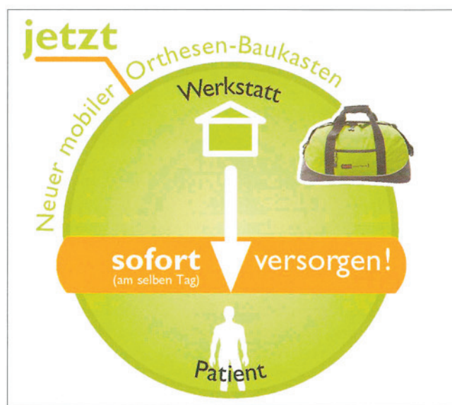
Neue WS-Versorgung mit mobilem Baukasten.