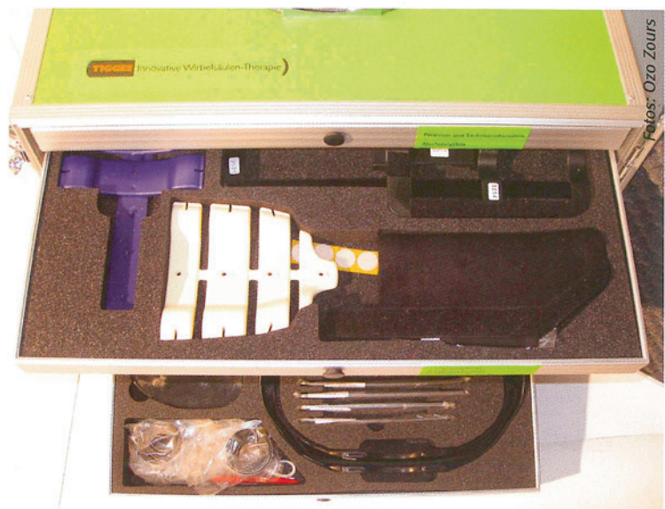
Alle Module des Baukasten-Systems sind übersichtlich angeordnet.

Techniker im Vorfeld erörtern und ggf. vor Ort erproben. Dies würde aber voraussetzen, dass der Techniker anschließend den Patienten in der Klinik mit jeder der neuen Orthesenversionen maßgenau versorgen und Änderungen bzw. Aufbauten zu einer größeren Orthese, nach Absprache mit dem Arzt, sofort vornehmen können sollte – bisher ein kaum machbares Unterfangen.